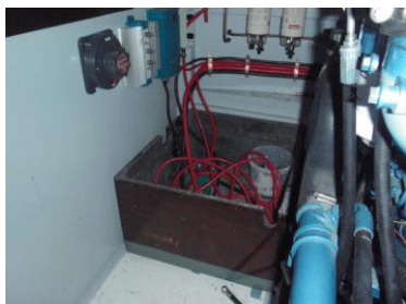
Accubak, hoofdschakelaar, diode brug en lader...