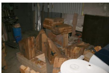
En dit moet er ook nog in...