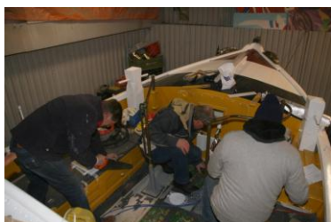
Drukte in de stuurkuip...