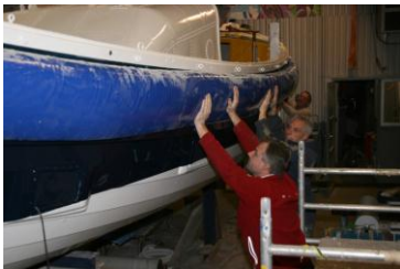
Het passen van de fenders. Ze worden momenteel door ons aangepast...

gezet, maar het is niet anders en we moeten de uitkomst eerst afwachten.