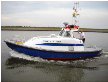
Een kleiner ORG bootje...Er zijn ook grotere van 60 ton!