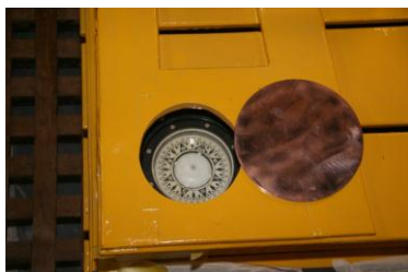
'Verstopt' kompas in de kuipbank...