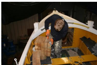
Het schuim moet weer op zijn plaats en hier en daar iets bijgeschaafd worden.