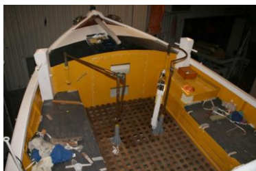
Overzicht van de stuurkuip