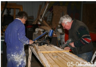
'Kaal halen' van de banken en schotten uit de kuip blijft een flinke klus.