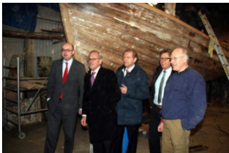
Het college, onder de indruk..