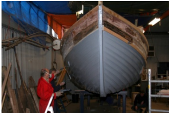
Buitenzijde van de romp in de grondverf van International Paint van AKZO