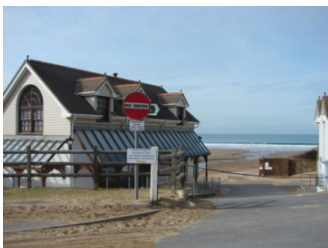
Ons gedroomde nieuwe botenhuis, dicht bij de vuurtoren.

Van het VSBfonds ontvingen we begin van het jaar een toezegging voor € 6.000,- subsidie. Voorwaarde is het verkrijgen van de A- status als varende monument en toezending van de officiële jaarrekening, wat we nu recent gedaan hebben.