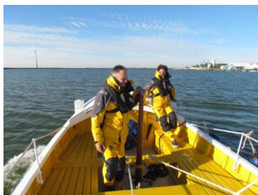
DE KC VER OP HET BINNENWATER