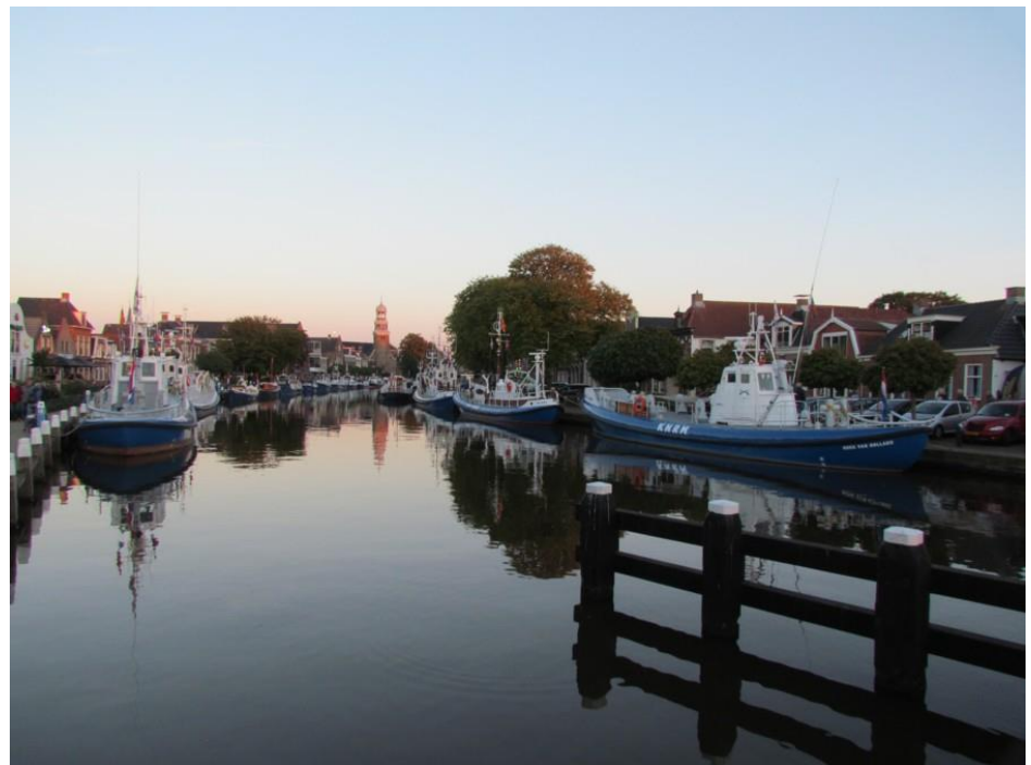
Weekend van 27 en 28 september in Lemmer met 27 oude reddingboten en schitterend weer.