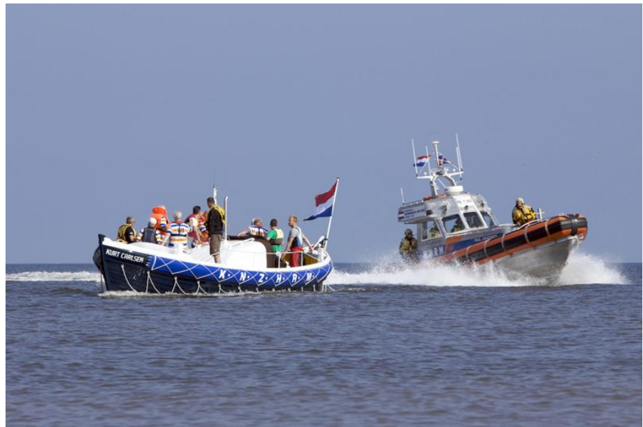
De eerste proefvaart onder toezien oog van de KNRM HAVENFESTIVAL IJMUIDEN, 31 AUGUSTUS 2013:

De vrijwilligers van de Kurt Carlsen hebben na drie jaar klussen deze zomer een welkome afwisseling achter de rug. Er is vrij veel gevaren. Totaal hebben we, vanaf de maand juli de boot 10 maal gelanceerd voor korte en langere tochten. We wilden en moesten varen. Moesten om het lanceren en weer droog halen onder de knie te krijgen.