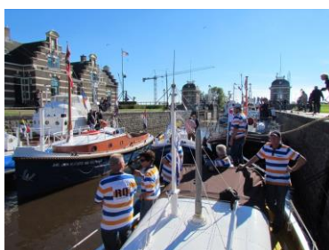
SLUIS VAN LEMMER VOL MET OUDE REDDINGBOTEN

Tijdens de jaarvergadering op zaterdag konden we in de vergadering nog even ons wensenlijstje met ontbrekende oude spullen opnoemen. Dat bleek begin oktober succes te hebben toen het KNRM station Egmond ons een stalen haspel, die thuishoort achterop de materiaalwagen, cadeau of in bruikleen deed.