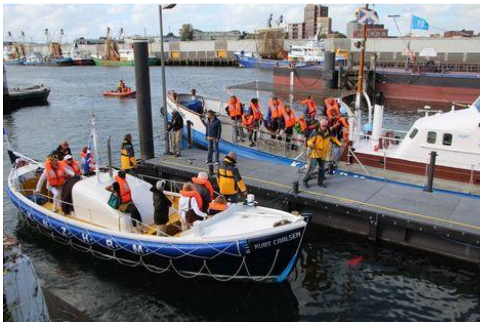
Havenfestival IJmuiden, 31 augustus. Varen met potentiële donateurs voor de KNRM