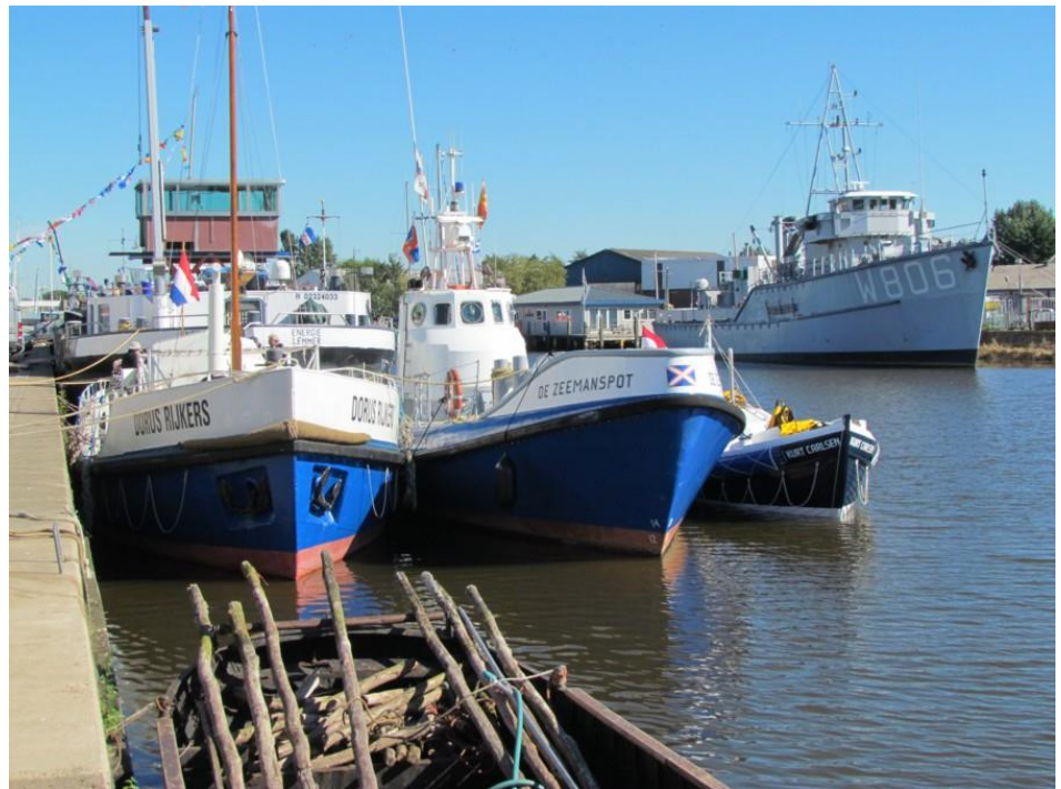
De KC in Lemmer, naast de jongere Zeemanspot en de veel oudere Dorus Rijkers