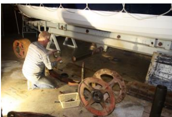
DEMONTAGE VAN DE TRACKS