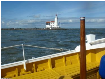
HET PAARD VAN MARKEN