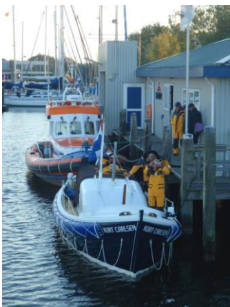
GASTVRIJ BOOTHUIS KNRM LEMMER